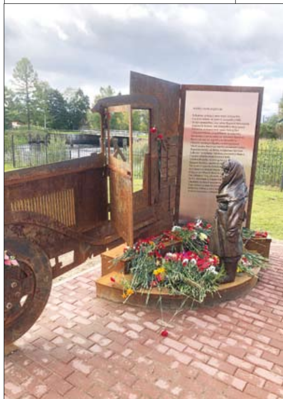
Фото и схема предоставлены заведующим музеем «Кобона: Дорога жизни» С.В. Марковым

Эти стихи, размещенные на «металлической тетради», некоторые посетители музея не могут читать без слез. Водители Дороги жизни в дни блокады спасли более миллиона ленинградцев, рискуя жизнью. Сохранить память об их подвиге — долг ныне живущих. После посещения музея в Кобоне открывается полное понимание Великого трудового подвига наших предков по спасению Ленинграда. МФ